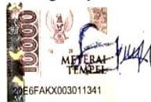
Syayyid Assyubbanul Habib