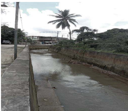
Gambar 1. Sungai Segmen Tanah Datar

Kondisi sekitar sungai pada setiap segmen memiliki karakteristik yang berbeda. Pada segmen Tanah Datar bagian kanan dan kiri sungai sudah mengalami seminisasi. Bagian bantaran sungai segmen Tanah Datar tidak dijumpai adanya rumah ataupun pemukiman warga di atasnya. Sekitar titik segmen tidak ditemukan adanya industri.