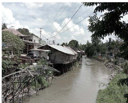
Gambar 2. Sungai Segmen Waduk Benanga

Hal berbeda ditemukan pada segmen Waduk Benanga. Observasi yang dilakukan mendapatkan hasil bahwa di segmen tersebut terdapat rumah yang berada diatas bantaran sungai. Industri tahu juga ditemukan di sekitar segmen tersebut. Kondisi sungai juga berbeda dengan yang ada di segmen Tanah Datar. Bagian kanan dan kiri sungai tidak mengalami seminisasi.