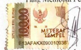
Sinta Ayu Lestari