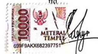
Vasya Syahla Putri