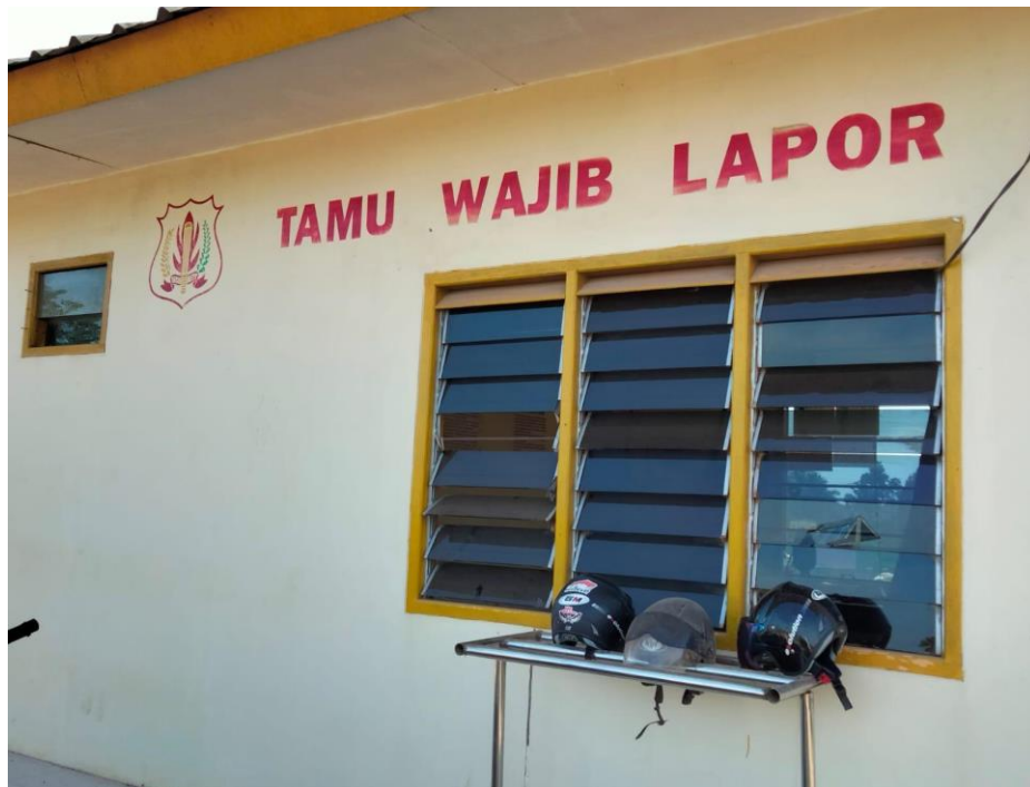
Keterangan : Security Pos