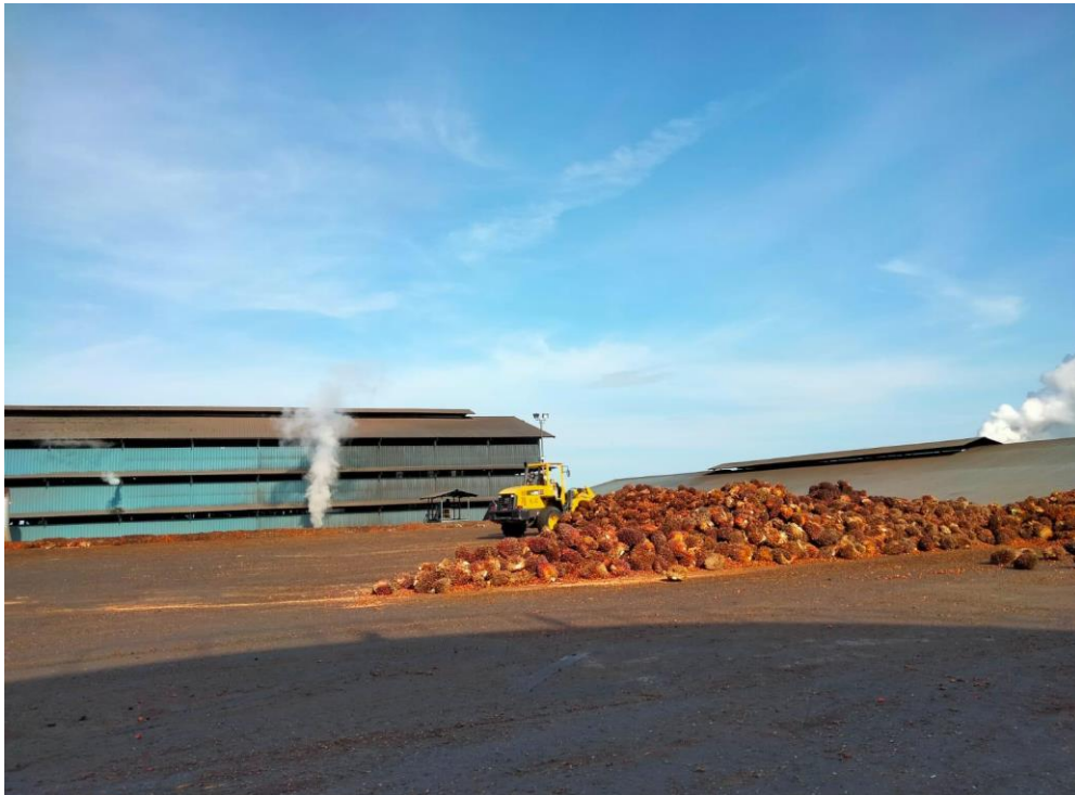
Keterangan : Tempat awal sawit masuk