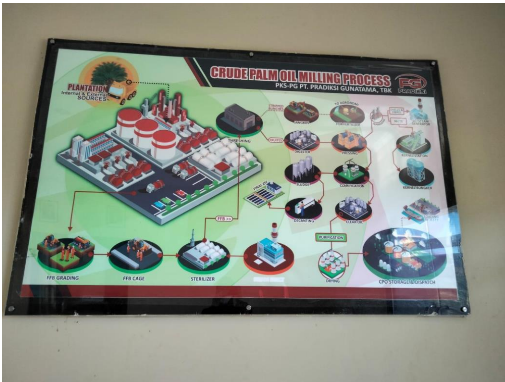
Keterangan : Peta Proses Pada Pabrik Kelapa Sawit