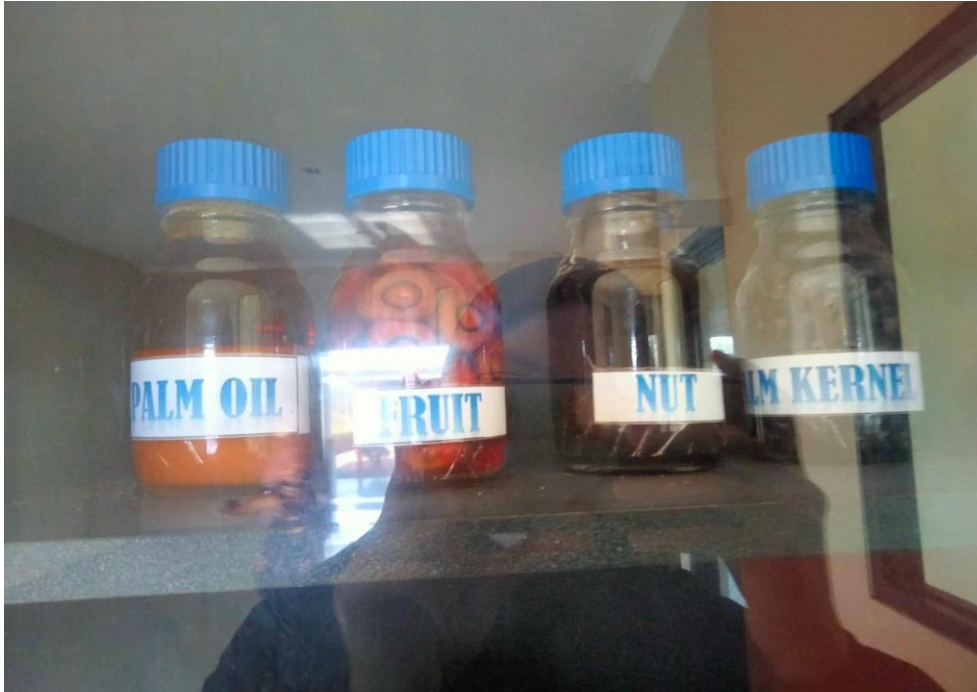
Keterangan : Output yang dihasilkan