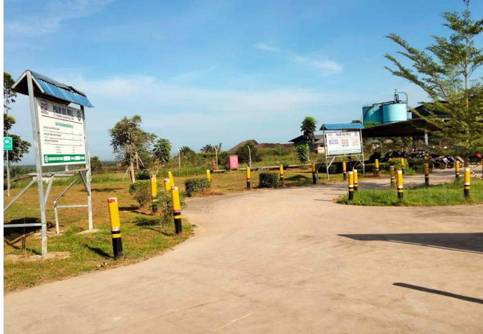
Keterangan : Lokasi Penelitian