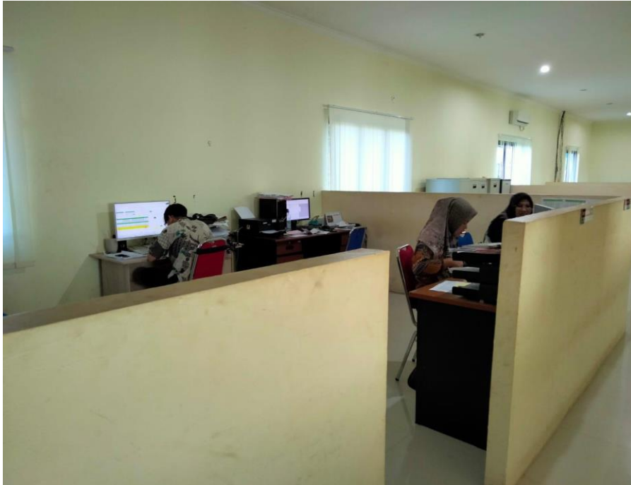
Keterangan : Kantor Administrasi Pabrik Kelapa Sawit