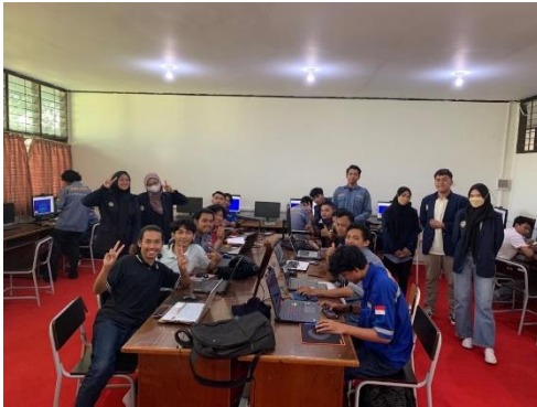
Dokumentasi Bersama Mahasiswa Teknik Mesin