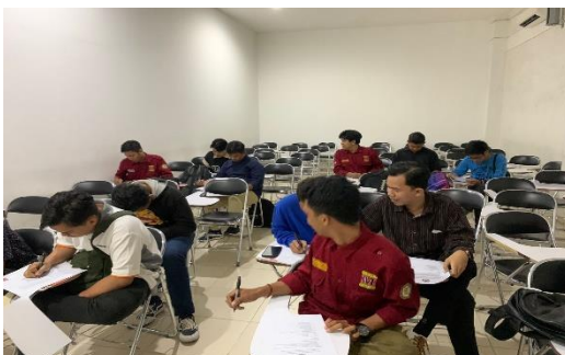
Melakukan Uji Validitas Pada Mahasiswa di Teknik Mesin UMKT