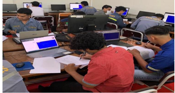
Responden Mengisi Kuesioner Penelitian Di Politeknik Negeri Samarinda