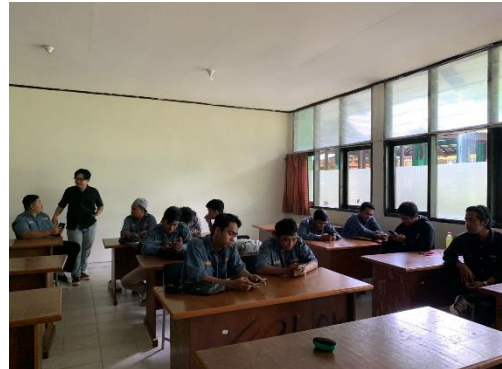
Responden Mengisi Kuesioner Penelitian Di Politeknik Negeri Samarinda