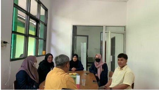
Izin Melakukan Penelitian dengan Kepala Jurusan Teknik Mesin di Politeknik Negeri Samarinda