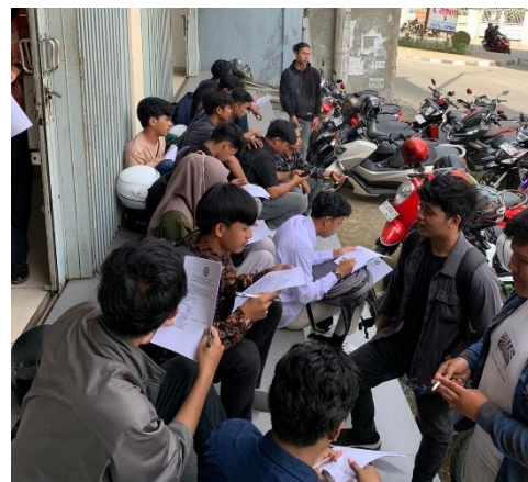
Melakukan Uji Validitas Pada Mahasiswa di Teknik Mesin UMKT