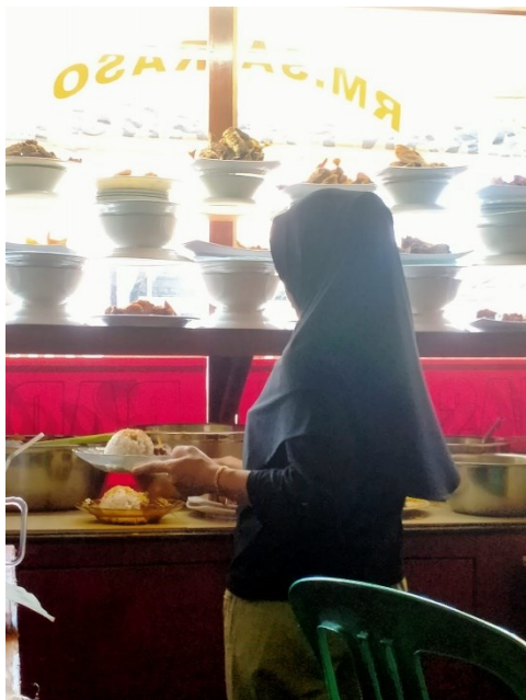
Penjamah Makanan Menggunakan Perhiasan Saat Menjamah Makanan