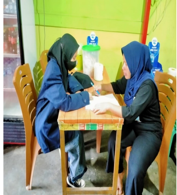
Wawancara Terhadap Responden