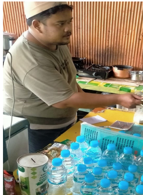
Penjamah Makanan Tidak Menggunakan Celemek