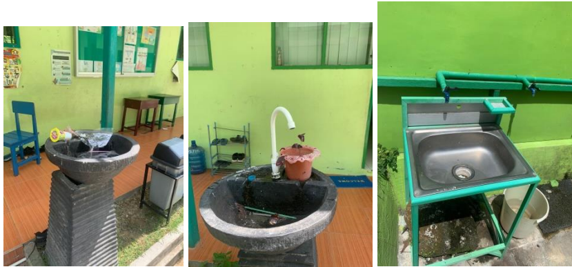
Gambar 1.6 Pengisian Lembar Kuesioner SD Muhammadiyah 6