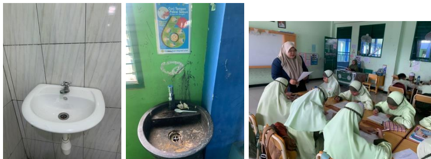
Gambar 1.5 Pengisian Lembar Kuesioner SD Muhammadiyah 5