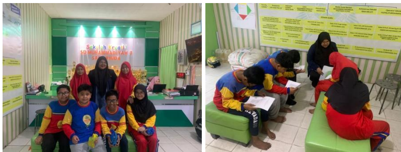
Gambar 1.3 Pengisian Lembar Kuesioner SD Muhammadiyah 3