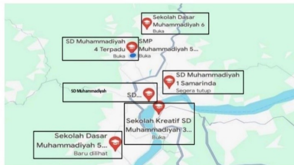
Gambar 4.1 Peta SD Muhammadiyah Samarinda

Penulis melakukan penelitian di wilayah di SD Muhammadiyah Kota Samarinda. Kota Samarinda terdiri dari 718,00 km 2 dan terletak antara garis 117003'00" Bujur Timur dan 117018'14" Bujur Timur serta garis 00019'02" Lintang Selatan dan 00042'34" Lintang Selatan.