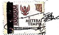
Fahren Anjas Dwiyanto