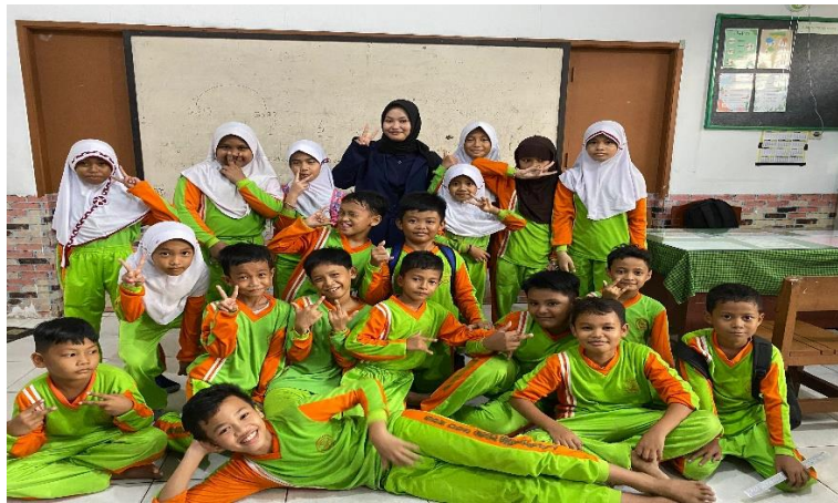
Gambar 4. Melakukan Pengambilan Data