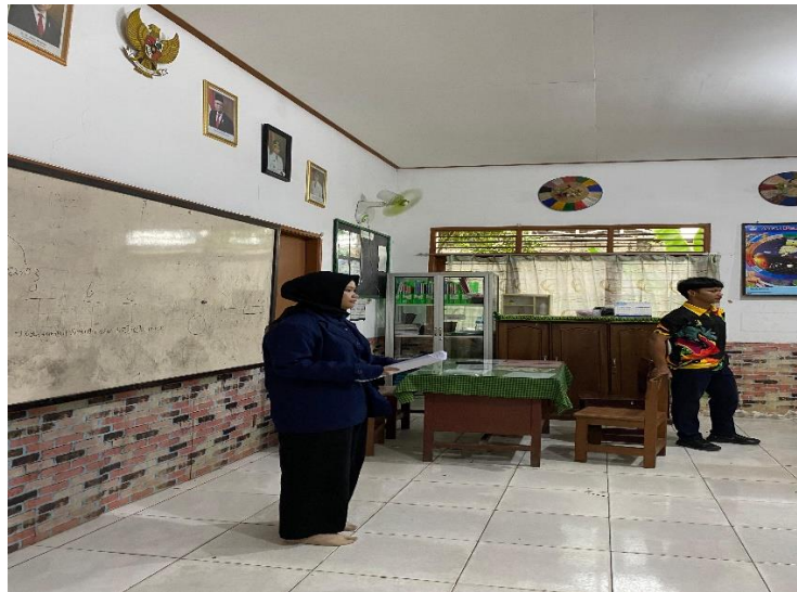
Gambar 2. Membagikan kuesioner kepada siswa