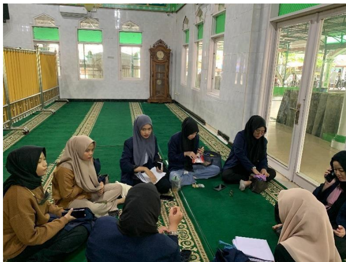
Gambar. 4 evaluasi kegiatan