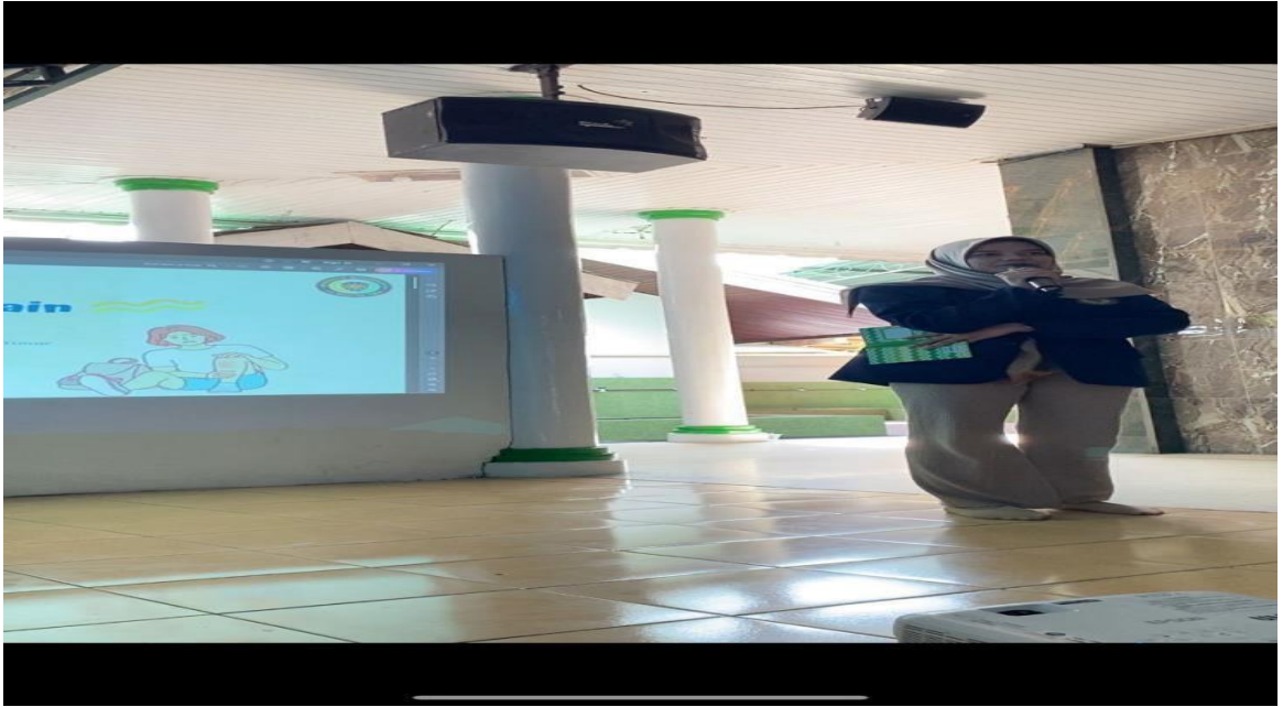
Gambar. 1 foto pembukaan acara oleh moderator