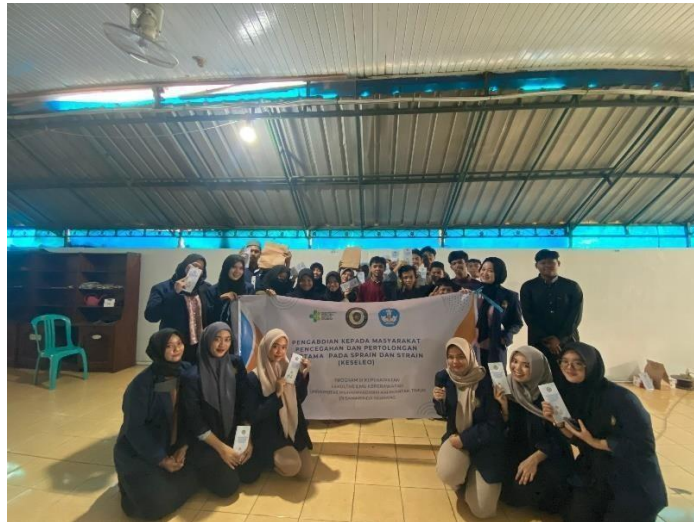
Gambar. 5 dokumentasi masyarakat