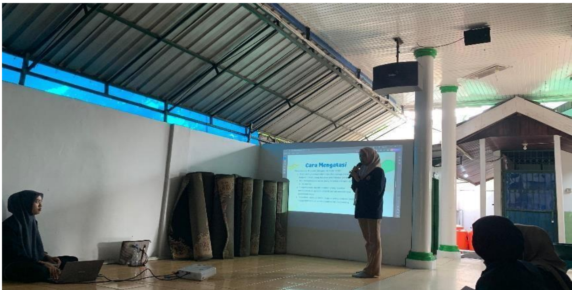
Gambar 2. Foto penyampaian mater