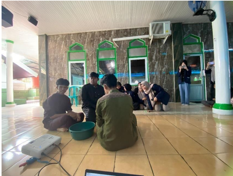
Gambar. 3 foto demonstrasi masyarakat