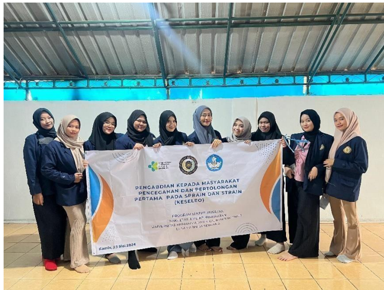
Gambar. 6