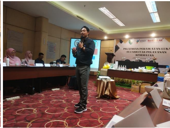
Dokumentasi penyampain materi