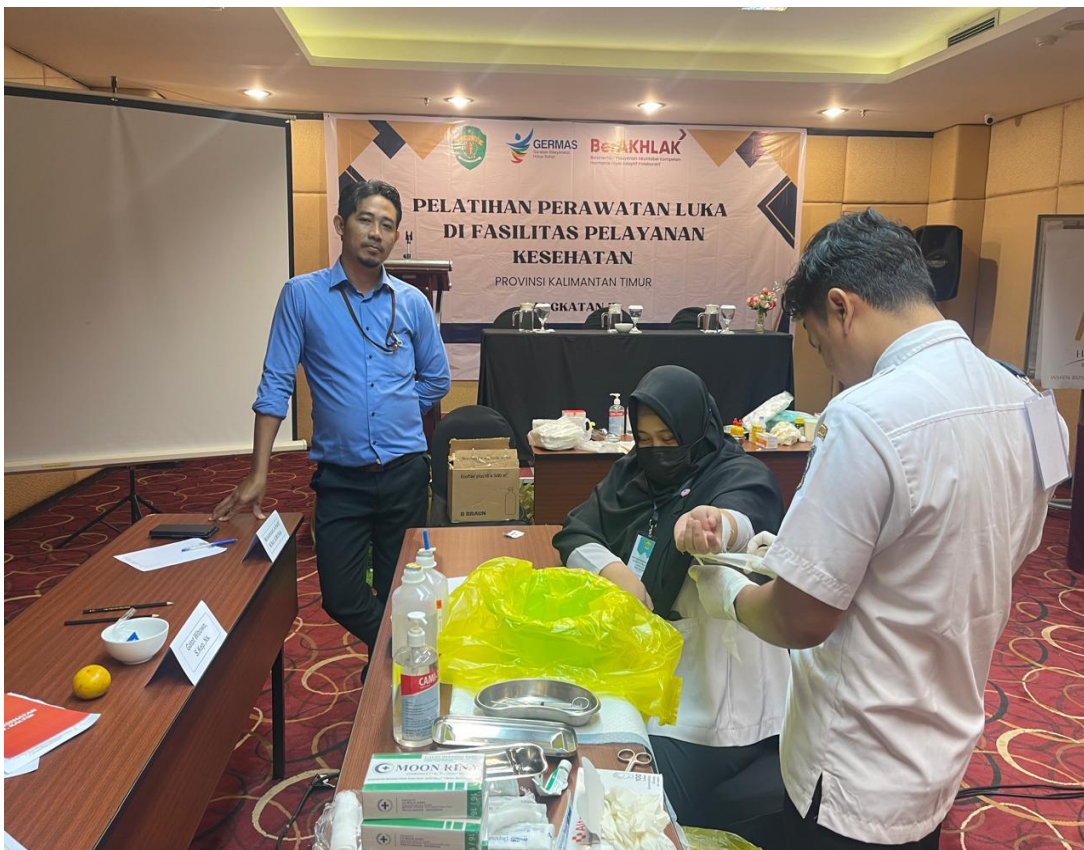
Dokumentasi Ujian Praktik