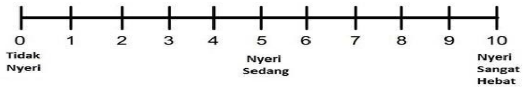
Gambar 2.2 Skala Numerik Rating Scale

Skala penilaian numerik ( Numerical Rating Scale , NRS) lebih digunakan sebagai pengganti alat pendeskripsian kata (Maryunani, 2014). Dalam hal ini pasien menilai nyeri dengan menggunakan skala 0-10: